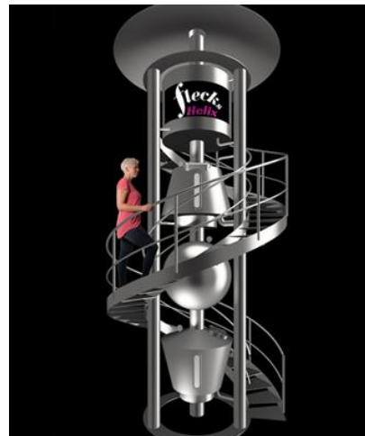
Flecks HELIX Brau-Turm 3 & 5 HL

Bauen Sie sich Ihre komplette Brauerei mit Hilfe unserer Module selbst zusammen: