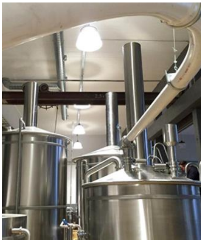
FLECKS Craftbier Brauerei 3-5-10-20-30-50 HL