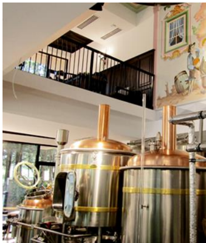
FLECKS klassische Gasthausbrauerei 3-5-10-20 HL