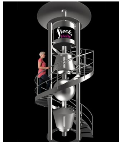
FLECKS HELIX Brau-Turm 5 HL

Bauen Sie sich Ihre komplette Brauerei mit Hilfe unserer Module selbst zusammen: