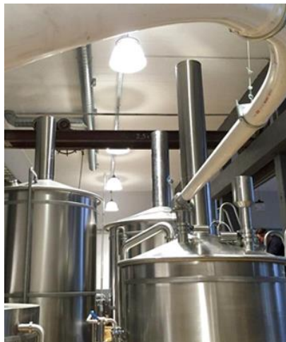
Craftbier Brauerei 3-5-10-20-30-50 HL